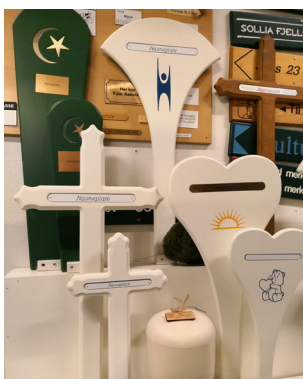
Kanskje blir slike ventetegn å se på Vardåsens urnelund?

Asker Produkt driver bl.a. internservice med renhold, vaskeri og varelevering, makulerings-tjenester, produserer trevarer som markaskiltene til Den Norske Turistforening, fjøler, juletrepynt og nettbrettstativ, postkasseskilt o.l. og har en stor avdeling med kantinedrift, både internt og tre eksterne. De leverer kommunens møtemat,